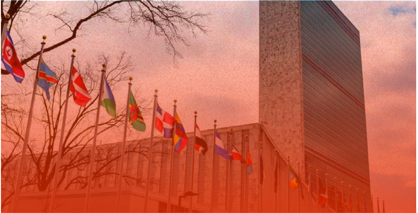
Ein Blick auf die Flaggen und das Sekretariatsgebäude vom Seitengang vor dem UN-Hauptquartier aus, 10. März 2023